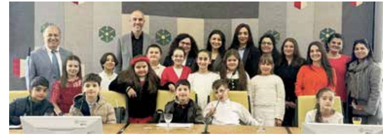
Hannover Büyükşehir Belediye Başkanı Belit Onay'ı makamında ziyaret eden öğrenciler, belediyenin işleyişi hakkında bilgi alırken merak ettikleri sorularını sorma fırsatı buldu.

Bir öğrencinin "Profesör olmak için ne yapmak gerekir?" sorusu üzerine Özdemir, disiplinli çalışmanın ve erken yaşta hedef belirlemenin önemine dikkat çekti. Başarının tesadüf olmadığını vurgulayan Özdemir, öğrencilerin öğretmenlerini