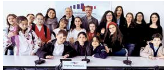
Milletvekili Deniz Kurku ile parlamento locasında bulunan öğrenciler, demokratik temsil ve gençlerin siyasetteki rolü üzerine samimi bir söyleşi gerçekleştirdi.

Kurku, milletvekilliğinin görev ve sorumlulukları hakkında detaylı bilgiler vererek siyasi çalışmaların nasıl yürütüldüğünü anlattı. Öğrencilerin sorularını içtenlikle yanıtlayan Kurku, gençlerin bu tür etkinliklerle bilinçlenmesinin ve kendilerini geliştirmelerinin önemine dikkat çekti.